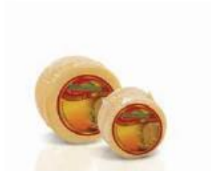
Round piece 0.500, 0.200kg