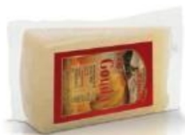
Triangular piece 0.300