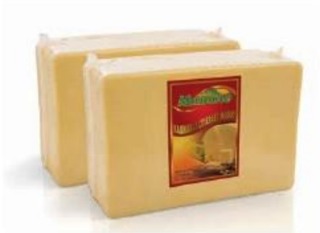
Rectangular block 8kg