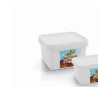
PVC box 0.900kg, 0.400kg