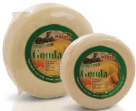
Round cake 5kg