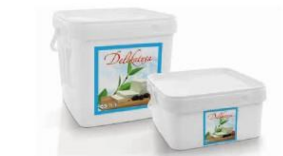
PVC box 8kg, 4kg