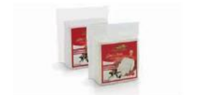
Vacuum 0.800kg, 0.400kg