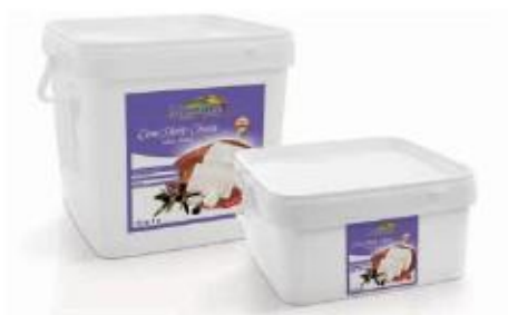
PVC box 8kg, 4kg

* Data for 50% cow / 50% sheep milk cheese