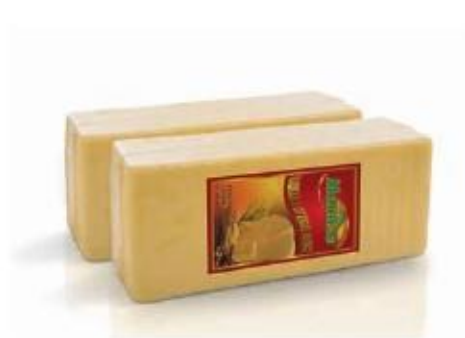
Rectangular block 4kg