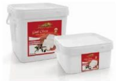
PVC box 8kg, 4kg