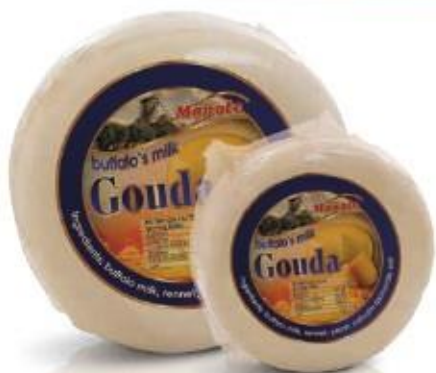
Round cake 5kg