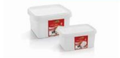
PVC box 0.900kg, 0.400kg