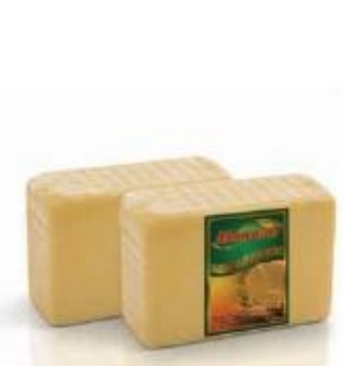
Rectangular block 1kg