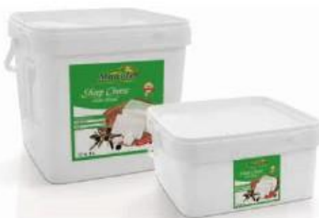
PVC box 8kg, 4kg