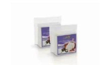
Vacuum 0.800kg, 0.400kg