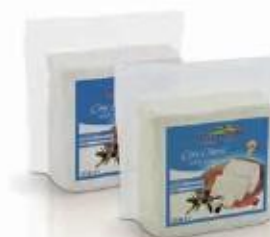
Vacuum 0.800kg, 0.400kg