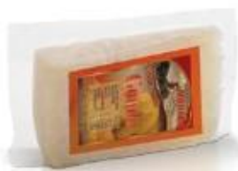
Triangular piece 0.300