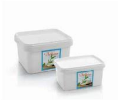
PVC box 0.900kg, 0.400kg