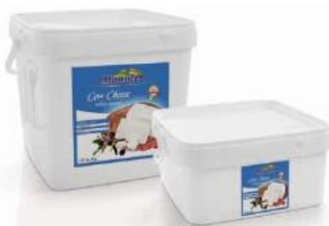
PVC box 8kg, 4kg