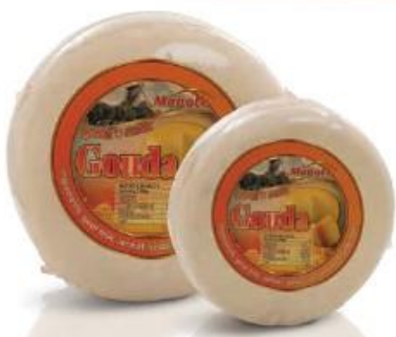
Round cake 5kg