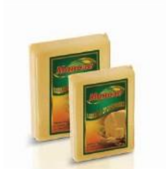
Rectangular piece 0.600kg, 0.300kg Round piece 0.500kg, 0.200kg