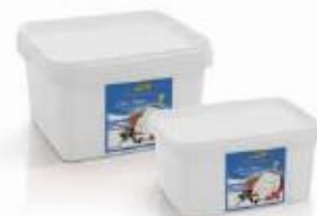
PVC box 0.900kg, 0.400kg