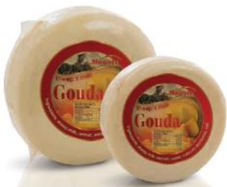
Round cake 5kg