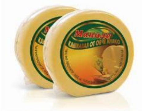
9kg round cake

Producto: Semi curado, 30 días de curación. Contiene leche de oveja 100% natural, levadura natural e sal.