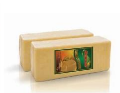
Rectangular block 4kg