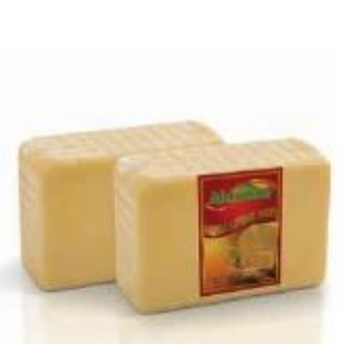
Rectangular block 1kg