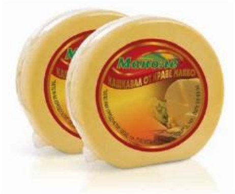
9kg round cake

Producto: Semi curado, 30 días de curación. Contiene leche de vaca 100% natural e sal.