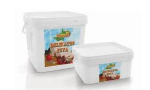
PVC box 8kg, 4kg