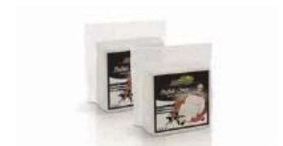
Vacuum 0.800kg, 0.400kg