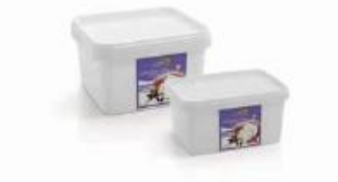
PVC box 0.900kg, 0.400kg