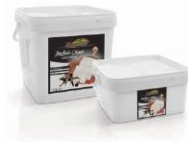
PVC box 8kg, 4kg