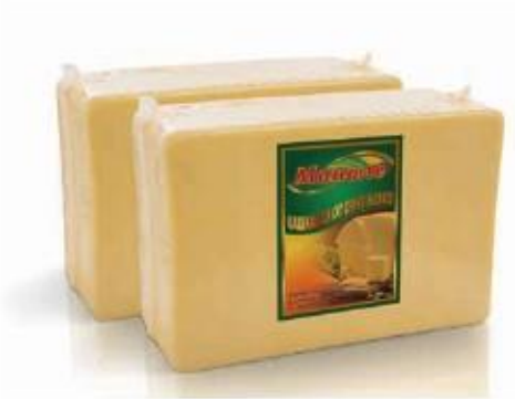
Rectangular block 8kg