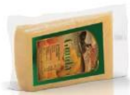
Triangular piece 0.300