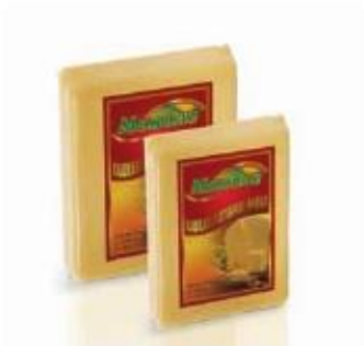
Rectangular piece 0.600, 0.300kg