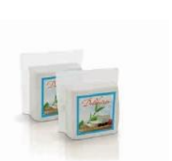
Vacuum 0.800kg, 0.400kg