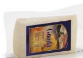
Triangular piece 0.300